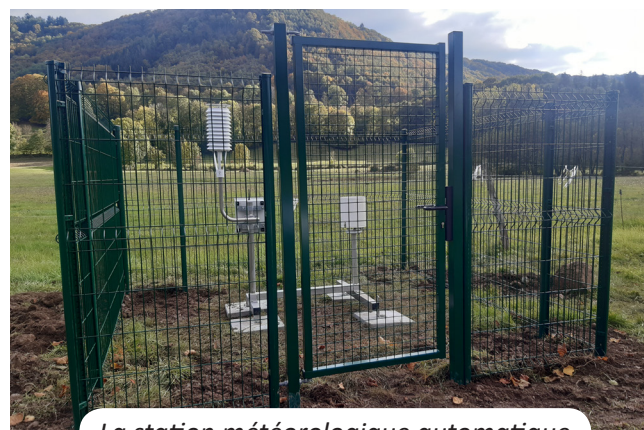
La station météorologique automatique

Depuis fin 2016, Météo-France s'est engagé dans la modernisation de ce réseau, avec pour objectifs d'automatiser une partie des stations de mesures jusque là tenues par des bénévoles et de le recentrer principalement sur des postes possédant un historique de plusieurs décennies.