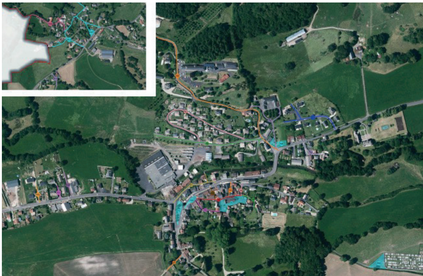
Carte du Bourg et Péruéjous