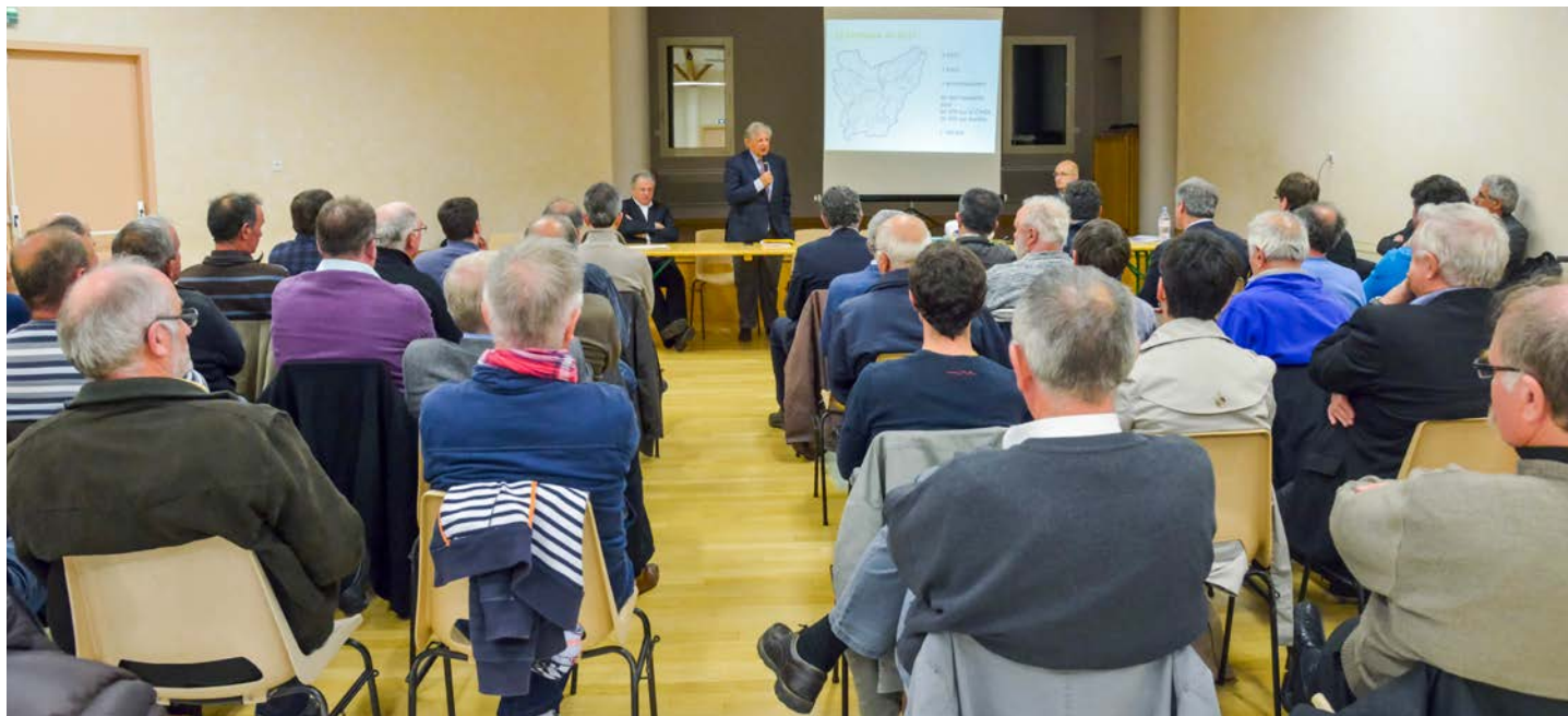
Réunion publique de présentation

Enfin, le SCoT est porteur d'objectifs de maîtrise de la consommation foncière, pour tendre vers une réduction d'environ un tiers de la consommation d'espaces naturels et agricoles. Poursuivre et dynamiser le développement du territoire en consommant moins de foncier : tel est l'objectif ambitieux recherché par le projet de SCoT.