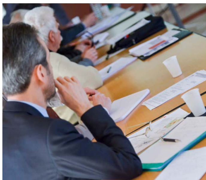
Atelier de travail

Pour répondre aux enjeux du diagnostic, le projet d'aménagement et de développements durables du SCoT est avant tout guidé par la volonté de développer l'attractivité territoriale. Le PADD est organisé autour de quatre axes qui visent tous à favoriser l'atteinte de cet objectif transversal d'attractivité territoriale.