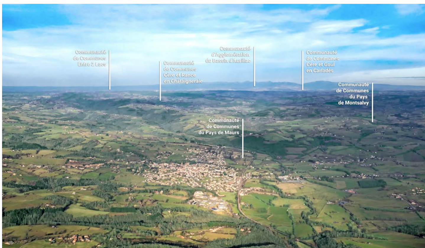
Le territoire du SCoT