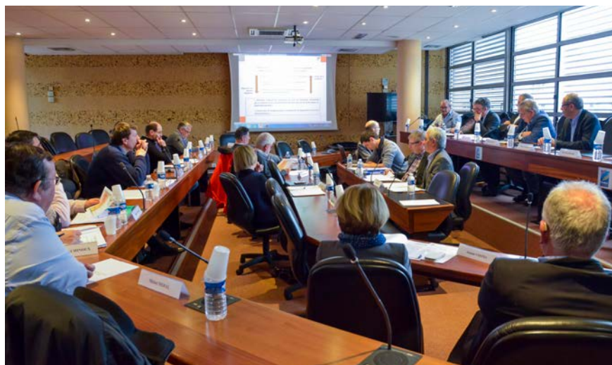
Réunion du Comité Syndical

Réponses du quizz : 2 : C - 3 : C - 4 : B - 5 : B - 6 : B